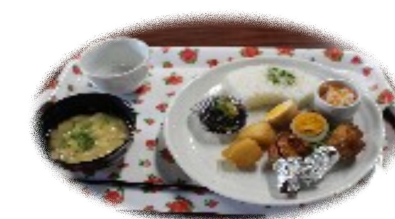
サロン活動のようす